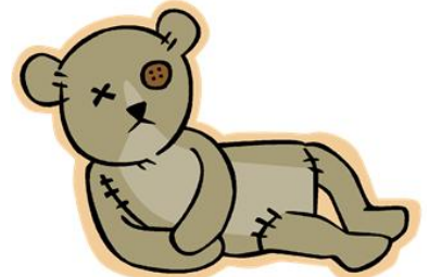
玩具 B：令皮膚敏感，有小件零件，容易讓小孩吞下。