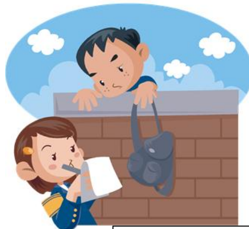
學校 B：地方混亂，學生不守秩序。