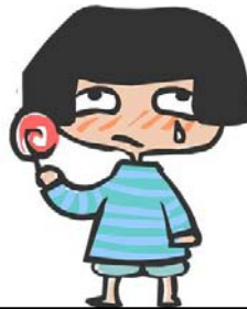
衣服 A：不合身，質料差