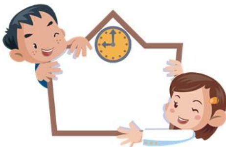
學校 A：地方整潔，學生守秩序。