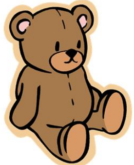
玩具 A：安全，不會令皮膚敏感