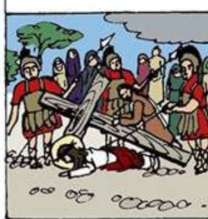
9. 耶穌第三次跌倒在地