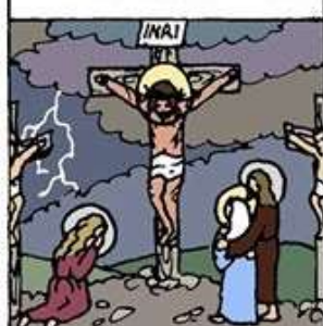
12. 耶穌在十字架上捨生