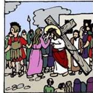
6. 韋羅尼加為耶穌抹面