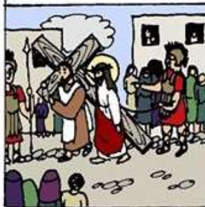
5. 西滿負擔耶穌的刑具