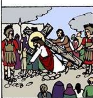
7. 耶穌再次不支而倒地