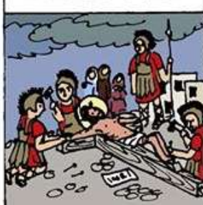
11. 耶穌懸在十字架上