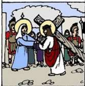
4. 耶穌遇見了 自己的母親