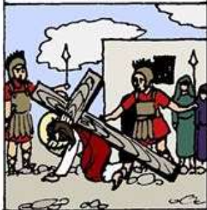
3. 耶穌體力不支 第一次跌倒地上